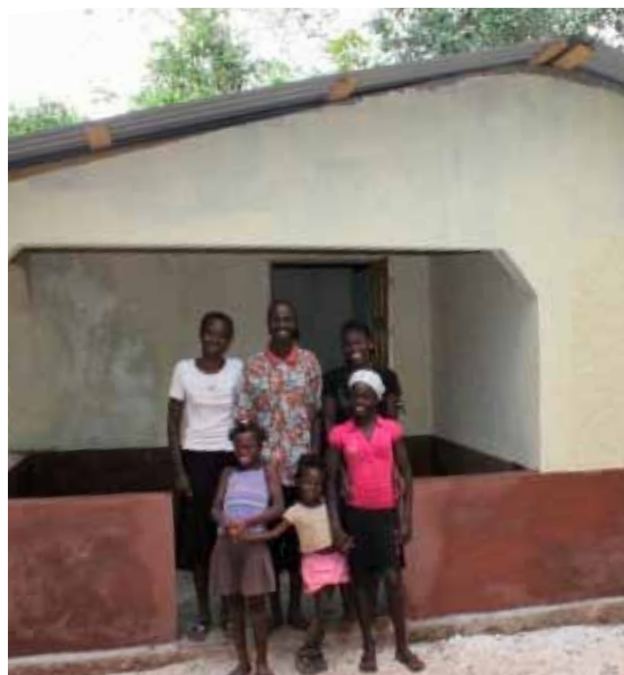
En glad familj vid sitt nybyggda hus med takplåt från Plannja och SSAB. Huset förstördes helt vid jordbävningen.

Själva distributionen av material till Haiti sköts av Human Bridge i Holsbybrunn utanför Vetlanda, en organisation som har lång erfarenhet av att samordna transporter av material till biståndsprojekt. Plannja och SSAB har levererat 12000 m 2 takplåt. Det motsvarar nästan två fotbollsplaner.