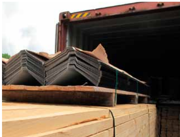
Här lastas takplåtarna i container hos Human Bridge i Holsbybrunn tillsammans med material för takstolar.

– Förhoppningsvis var den svåra jordbävningen en engångsföreteelse, men landet är mycket utsatt för orkaner. Nu kommer husen att klara dem bättre.