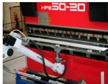
Den moderna maskinparken ger möjlighet att kundanpassa både korta och långa serier.

Det som gjort oss till en trogen partner är framför allt vårt genuina hantverkskunnande i kombination med skräddarsydda produkter och effektiv logistik.