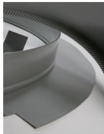
Vi är specialister på unika lösningar i plåt.

Med Plannja Steinwalls som samarbetspartner förenklas både byggprocessen och affärsprocessen.