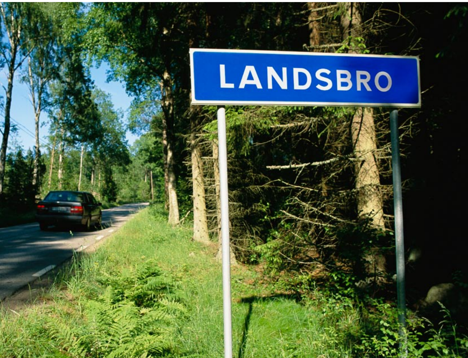
På Plannja Steinwalls spirar småländsk företagsamhet. Företaget ligger i Landsbro, 1,5 mil väster om Vetlanda.