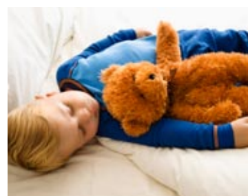
Effektiv bostadsventilation anpassas för varje hus. Med våra aggregat blir luften inomhus bättre än utomhus. Se separat produktbroschyr.