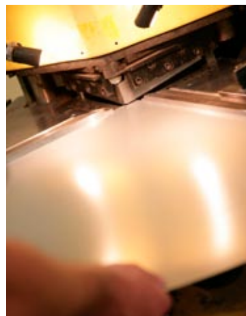
Vi är dessutom ett formstarkt företag som lika gärna tar oss an kvalificerade specialutföranden som standardlösningar.