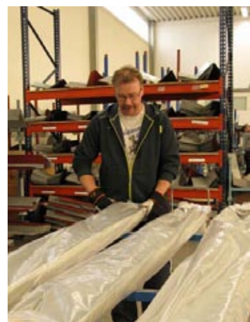
Dryga sextio år i branschen har gjort oss till en trygg leverantör från produktion och lager.

Logistikkedjan från förfrågan och order till produktion och leverans är kostnadseffektiv och precis.