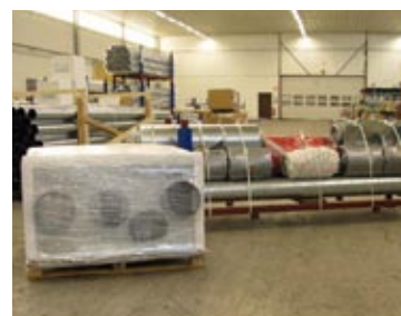
Vi levererar satsförpackade kompletta paket direkt till varje enskilt hus. Enklare kan det inte bli.