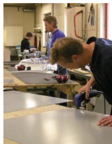
Vår hantverkstradition bygger på gedigna fackkunskaper och ett nyskapande som förenklar kundens byggprocess.