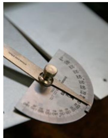
Skräddarsydda lösningar handlar om precision in i minsta detalj.

Vår gedigna produkt- och branschkunskap sträcker sig drygt 60 år tillbaka i tiden. Det gör oss in i minsta detalj till en högst tillförlitlig kunskapsbank och trygg samarbetspartner.