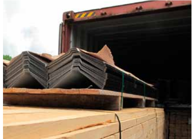
Tässä kuormataan kattolevyjä ja kattotuulimateriaaleja konttiin Human Bridgellä Holsbybrunnissa.

– Toivottavasti tämä paha maanjäristys oli yksittäistäpahtuma, mutta maa on myös erittäin altis hurrikaaneille. Jatkossa talot kestävätkin ne paremmin.