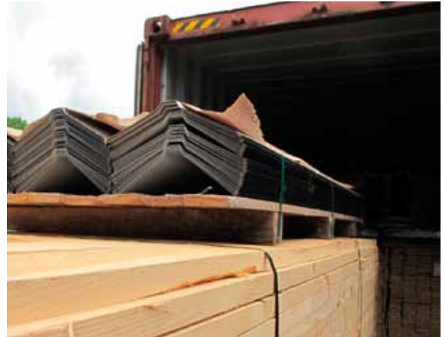
Her lastes tagpladerne i containere hos Human Bridge i Holsbybrunn sammen med materialer til spær.

– Forhåbentlig var det kraftige jordskælv en engangsforestilling, men landet er meget udsat for orkaner. Nu vil husene kunne klare dem bedre.