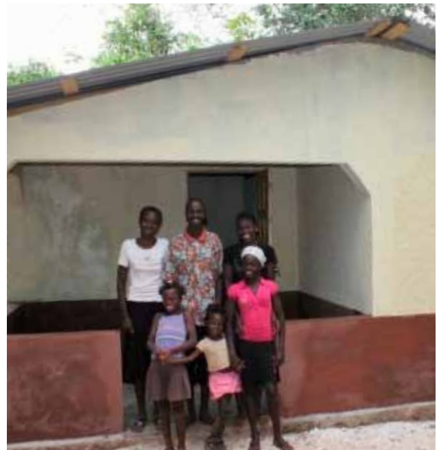
En glad familie ved deres nybyggede hus med tagplader fra Plannja og SSAB. Huset blev helt ødelagt ved jordskælv.

Selve distributionen af materialer til Haiti forestås af Human Bridge i Holsbybrunn uden for Vetlanda i Småland; en organisation, som har lang erfaring i at samordne transporter af materialer til bistandsprojekter. Plannja og SSAB har leveret 12.000 m 2 tagplader. Det svarer til næsten to fodboldbaner.